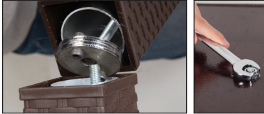
Şekil / Fig. 3