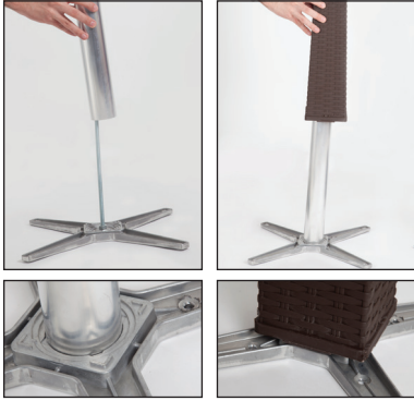
Şekil / Fig.2