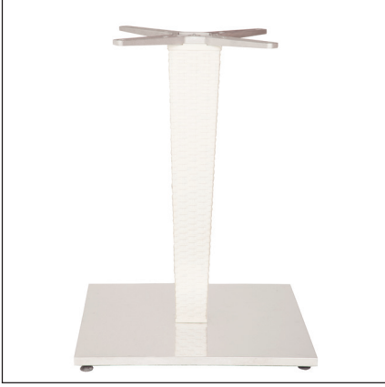
Tekli / Single