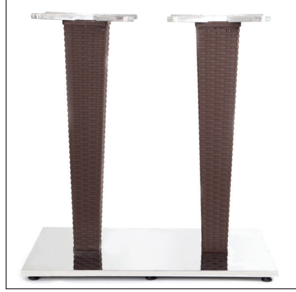
İkili / Double