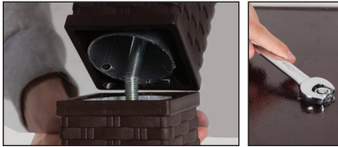
Şekil / Fig. 4

Şekil 1: Saplamaya M10 somun geçirilir. İstavrozun uygun yerine diğer somun koyulur ve saplamadaki somun uygun el aletiyle (M17 açık ağızlı anahtar) sıkılır.